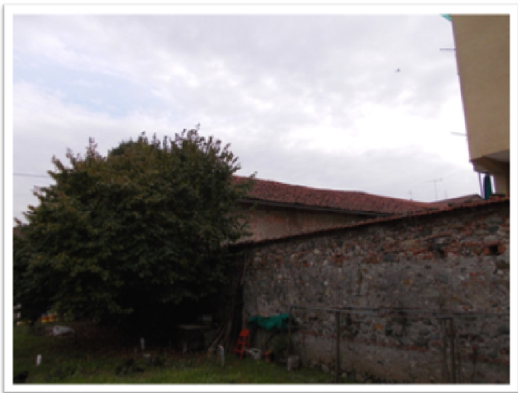
Foto 10 : vista del muro esistente dove verrà realizzato il collegamento tra le vie