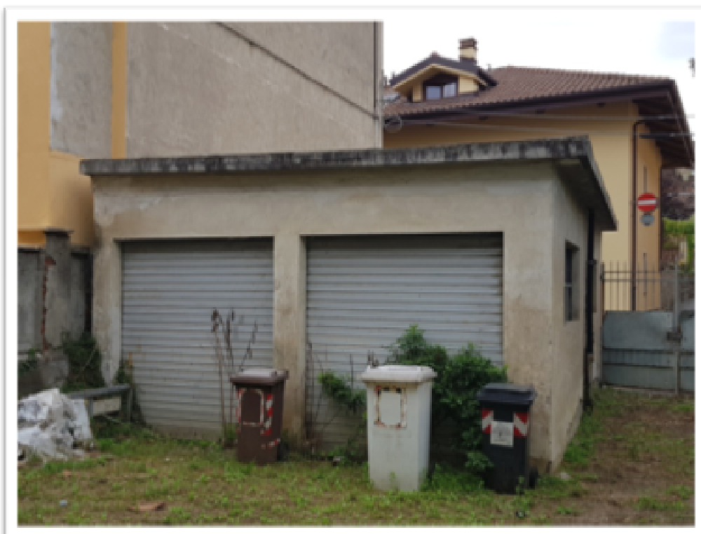
Foto 7 : vista del basso fabbricato ad uso autorimessa su via Gramsci